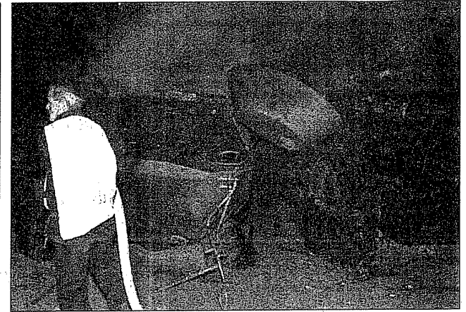
أحد القصف الإسرائيلي على أحد مواقع الامن الوطني في غزة