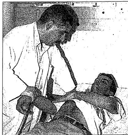
أحد مصابي القصف يتلقى العلاج في مستشفى الشفاء